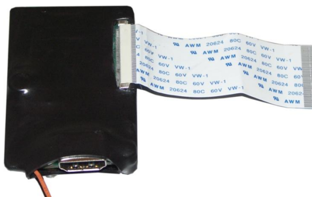
Рис.1. Общий вид адаптера

Адаптер CF Volvo XC60 LCD предназначен для вывода картинки штатного 5-дюймового дисплея автомобиля Volvo XC60 на дополнительно устанавливаемый монитор через интерфейс HDMI. Общий вид адаптера представлен на рис.1.: